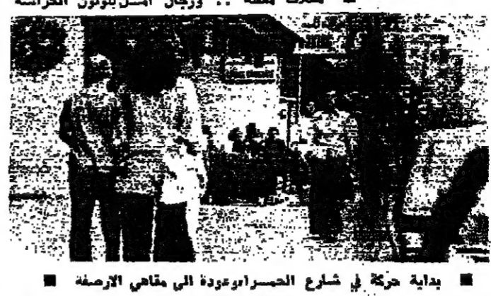
بداية حركة في شارع الحراير بعد عودة الى مقاصد الارض

من الشوارع توتناً كبيراً من المواطنين على شراء المواد الغذائية مما أدى الى نقص ملحوظ في الكميات المعروضة، ونقص ارتفع في اسعار معظم السلع الاستهلاكية. وامتدح يامع تواريسم الغار عن تسليحها بينما رفع بعضهم الاسعار ليعمل واحدة للثائرة في بعض ضواحي العاصمة. وتحدثت مستودعات الغار وبيوت توزع مساً لديها تلبية لحيليات المحلات والمستهلكين.